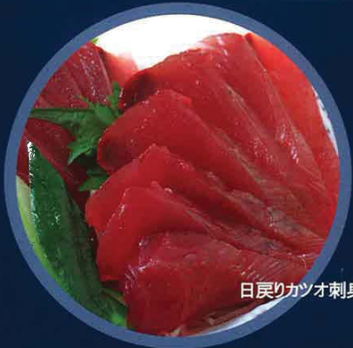
日戻りカツオ刺身

新鮮な日戻りカツオは、なんといっても“生”で食べなきゃ始まらない。この場所だから食べられる格別の味わいです。少しだけ醤油をつけ、カツオ本来の美味をご堪能下さい。