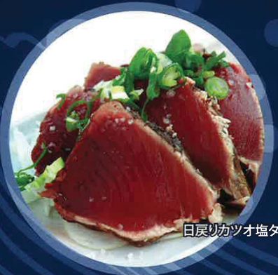
日戻りカツオ塩タタキ

土佐さがに注ぎ込む新鮮な黒潮からつくれる、極上の「天日塩」があります。カツオの風味を引き出して軽くその天日塩をふり、たたいて味をなじませる。素朴で豪快なカツオの塩タタキ。いくらでも食べられます。